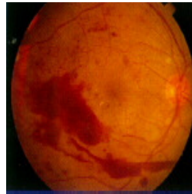
視網膜病變的眼底

當有新生血管沿視網膜表面或視神經盤開始生長時，即稱之為增生性糖尿病視網膜病變。PDR的主要原因是因視網膜血管的廣泛性阻塞而阻止了血液的正常流通。血管即因局部缺氧而反應增生用以供應缺血的視網膜。糟糕的是，增生血管更會帶來壞處。因新生血管不僅容易破裂造成出血且會伴隨結疤組織增生，而結疤組織會併發嚴重的視網膜剝離。