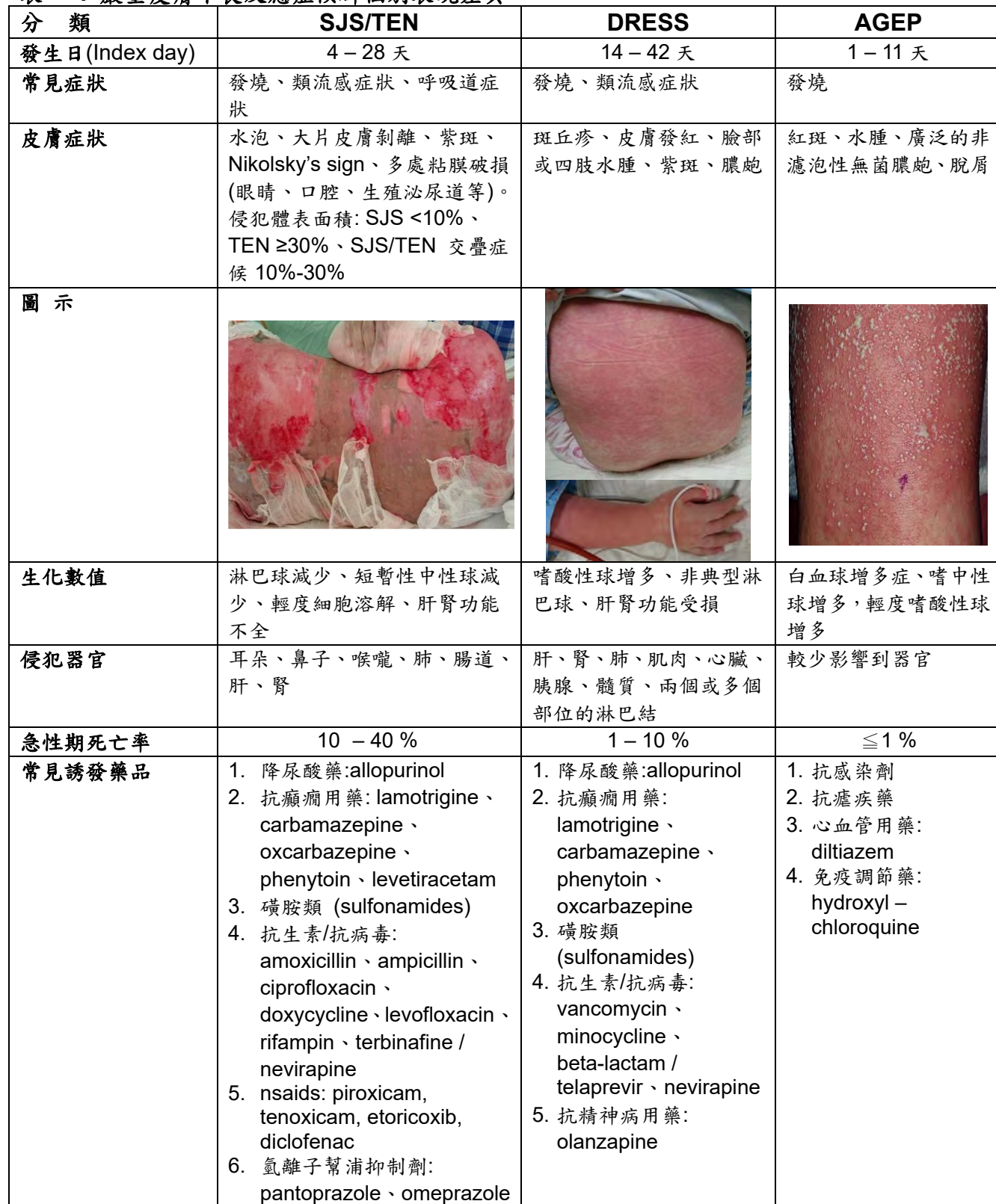
表一：嚴重皮膚不良反應症候群個別表現差異

嚴重度及死亡率相關性，呈如圖一 5 。常見引起症狀之藥品包含降尿酸藥(allopurinol)、抗癲癇藥 (lamotrigine、carbamazepine、oxcarbazepine、phenytoin)、磺胺類、抗生素、抗病毒、NSAIDs、氫離子幫浦抑制劑等，可