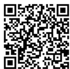
報名 QR code