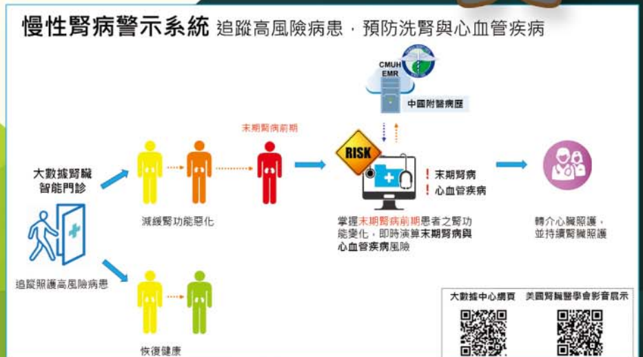
圖二、中國附醫慢性腎病風險警示矩陣系統