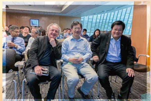
洪校長與世界級的癌症科學家學術交流

中國醫藥大學附設醫院與全球知名的美國德州大學安德森癌症中心為姊妹醫院，同時簽訂醫學人才與技術交流合作計畫，近年來攜手研發乳癌、肺癌、口腔癌等標靶藥物外，同時結合社區、臨床領域加強早期癌症篩檢，致力打造世界級跨國合作的癌症研究中心。