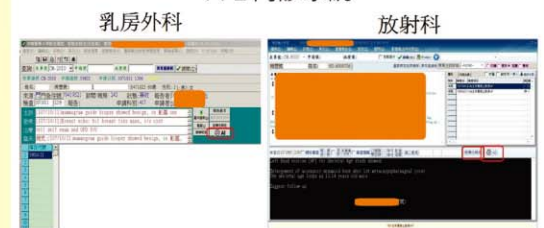
圖二、門診系統人工智慧網路系統