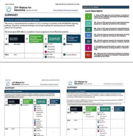
IBM Watson for Genomics 產出報告