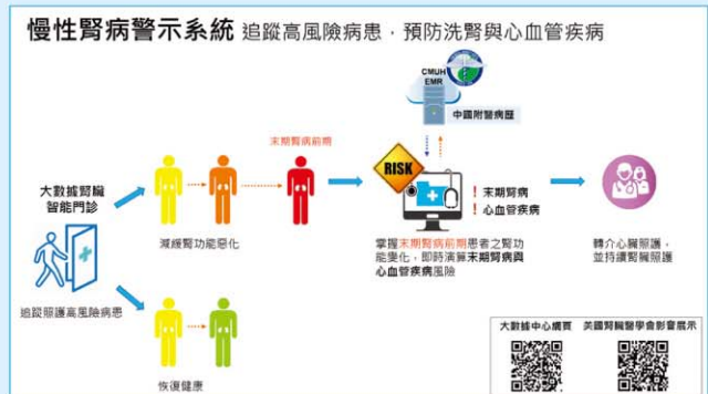
圖二、中國附醫慢性腎病風險警示矩陣系統