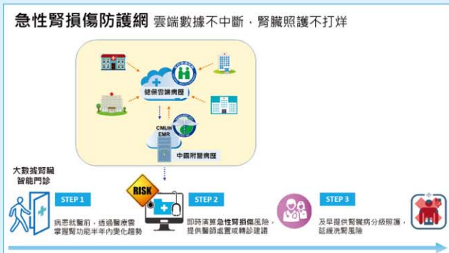
圖一、中國附醫急性腎損傷防護網