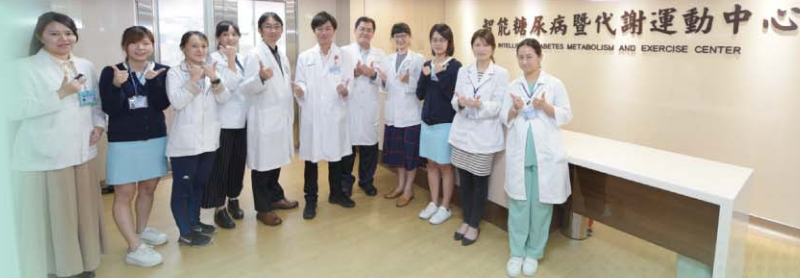
智能糖尿病暨運動代謝中心 美德大樓6樓 · 諮詢專線04-22052121分機1660

看診、檢查、抽血、營養諮詢、疾病衛教、運動體能評估、身體組成分析、營養動手做，打造就醫新體驗，免除勞苦奔波。