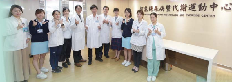
智能糖尿病暨運動代謝中心 美德大樓6樓 · 諮詢專線04-22052121分機1660

看診、檢查、抽血、營養諮詢、疾病衛教、運動體能評估、身體組成分析、營養動手做，打造就醫新體驗，免除勞苦奔波。