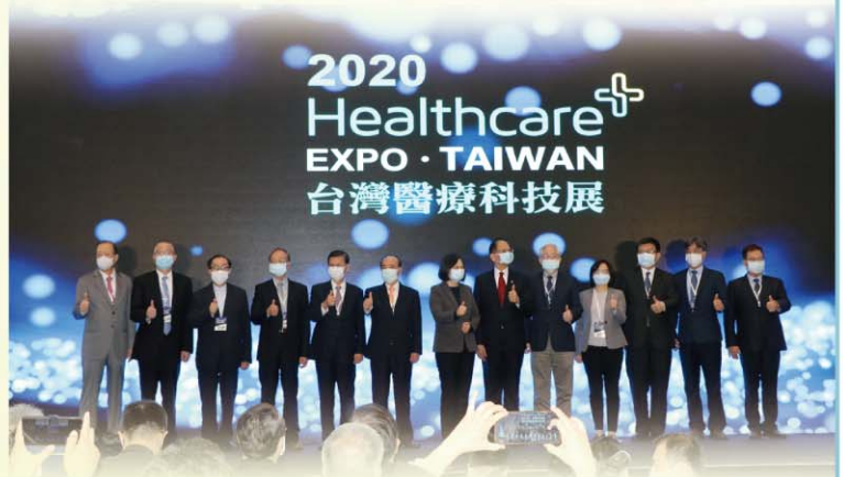
蔡英文總統蒞臨主持《2020台灣醫療科技展》揭幕式 （左一：生策會副會長蔡長海董事長）

在中國醫藥大學暨醫療體系蔡長海董事長的領導下，本校院不斷追求卓越，發展人工智慧醫療與高科技生醫產業，結合學界、醫界、產業界三方面，為台灣建立創新且完整的醫療產業生態鏈，發展精準健康，守護民眾的健康與生命。