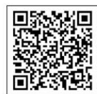
衛教講座活動 報名網站QR CODE