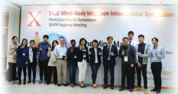
身心介面研究中心（MBI-Lab）團隊

蘇冠賓教授表示，孕期或產後憂鬱症是許多新手父母及醫護人員最關心的身心健康議題，為了讓醫療更適時介入高危險族群，簡單有效的篩檢是最重要的第一步，愛丁堡憂鬱量表（Edinburgh Postnatal Depression Scale, EPDS）是目前臨床上最常用的篩檢工具，然而，該工具使用上最大困難在於訂定的閾值（cut-off value）並不一致，因此，國際合作研究團隊進行大型資料分析，為了其敏感度（sensitivity）與特異度（specificity）兩者準確性極高。這次的大型研究屬於個人化資料統合分析，相對於傳統的統合分析，IPDMA不僅分析已發表的論文資料，更分析眾多研究背後受試者的原始資料，雖然花費更大的心力及時間，但得出的結果較傳統方法更加可靠！