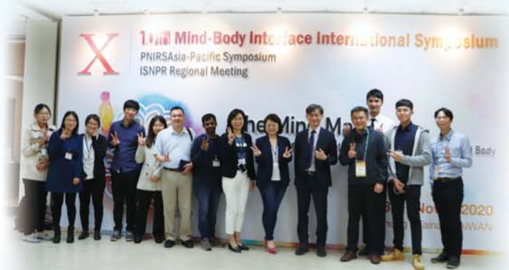
身心介面研究中心（MBI-Lab）團隊

蘇冠賓教授表示，孕期或產後憂鬱症是許多新手父母及醫護人員最關心的身心健康議題，為了讓醫療更適時介入高危險族群，簡單有效的篩檢是最重要的第一步，愛丁堡憂鬱量表（Edinburgh Postnatal Depression Scale, EPDS）是目前臨床上最常用的篩檢工具，然而，該工具使用上最大困難在於訂定的閾值（cut-off value）並不一致，因此，國際合作研究團隊進行大型資料分析，為了其敏感度（sensitivity）與特異度（specificity）兩者準確性極高。這次的大型研究屬於個人化資料統合分析，相對於傳統的統合分析，IPDMA不僅分析已發表的論文資料，更分析眾多研究背後受試者的原始資料，雖然花費更大的心力及時間，但得出的結果較傳統方法更加可靠！