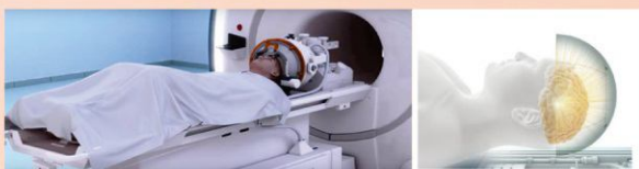
神波刀治療示意圖

巴金森病是年長者常見的動作障礙疾病，主要症狀包括動作遲緩、肢體顫抖、僵硬、步行及平衡障礙等，許多病人同時也有非動作障礙問題如便秘、失眠等。口服藥物雖然可以緩解部分症狀，但服藥的頻率及藥效的波動對許多病人而言仍是一件令人困擾的事情，且有些情況如嚴重的手部顫抖，即使規律服藥亦難以控制症狀。