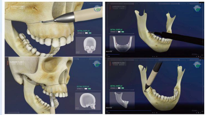
附圖1：隨切削部位不同所使用 超音波骨刀執行上顎截骨術