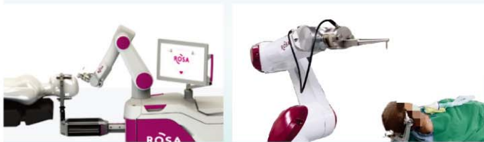
ROSA導航系統手術中實際狀況， 透過機器手臂精準定位，進行血塊抽吸

自2021年底引進ROSA機器手臂後，本院已執行了近30例ROSA腦血塊抽吸手術，經統計血塊清除率高，恢復時間更短且併發症發生率低，為出血性腦中風患者的一大福音。