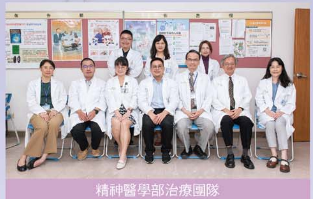
精神醫學部治療團隊