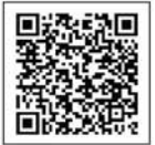
衛教講座活動 報名網址QR CODE