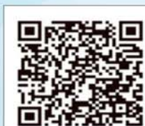
中國醫點通 App (iPhone/iPad)