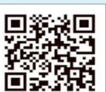
中國醫點通 App (Android)